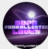
07.02.2021 Supa Funkallistic Lover