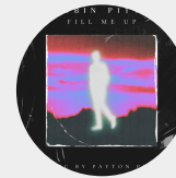
04.11.2022 Fill me up