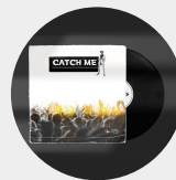
13.05.2021 Catch me