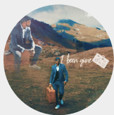
12.03.2020 I been gone