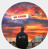
31.08.2020 So good