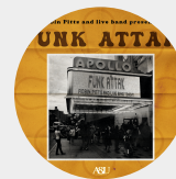
26.11.2021 Funk Attak