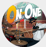
03.11.2020 On the one